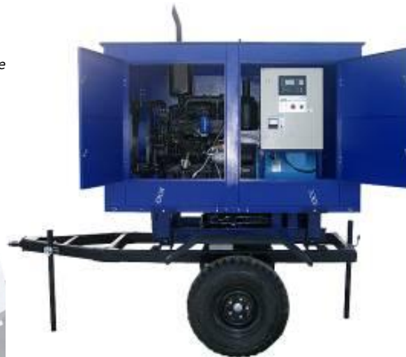
дизель-генератор в погодозащитном капоте шасси

Все исполнения электростанций адаптированы для установки на транспортные средства. В зависимости от условий эксплуатации и требований потребителей контейнерные электростанции могут быть смонтированы на двухосные автомобильные или тракторные шасси, а также на лыжи-полозья, сани, шасси автомобилей или полуприцепы.