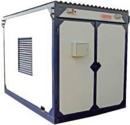
дизельная электростанция в блок контейнере «Север»

Дизель-генераторные установки в зависимости от условий эксплуатации могут быть выполнены в следующих исполнениях: