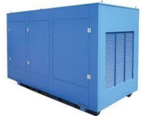
дизельная электростанция в энергомодуле.